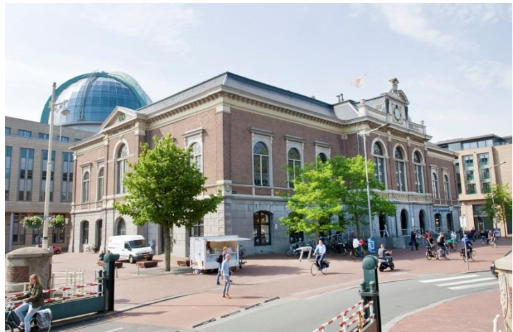
De Beurs, de toekomstige City Campus van RUG/CF.

Op vrijdag 24 juni 2016 werd bekend dat Campus Fryslân zal worden gehuisvest in het Beursgebouw in de binnenstad van Leeuwarden. Het nieuwe universiteitsgebouw bevindt zich in het hart van de stad en zal in totaal voor zo'n 1000 studenten (zowel bachelor-, master-, als PhD-studenten) onderwijs- en onderzoekruimte gaan bieden.