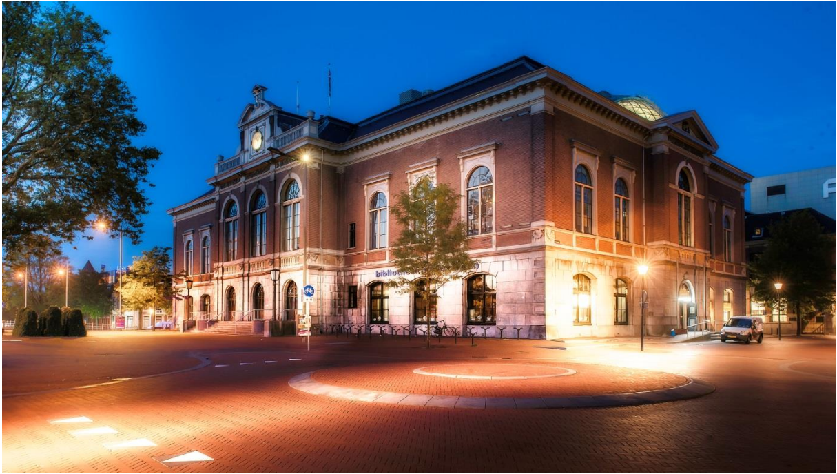
Het beursgebouw in Leeuwarden, het toekomstige faculteitsgebouw van Campus Fryslân