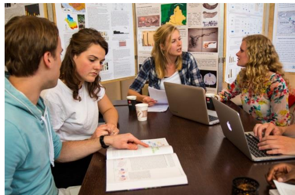
Studenten overleggen in werkgroepen

De financiële risico's die verbonden zijn aan een verminderde instroom – of een