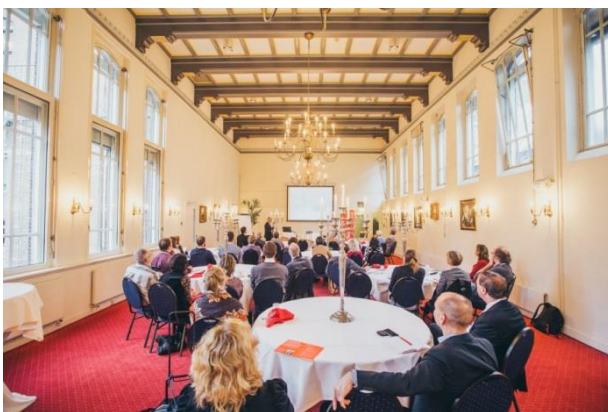
Opening Autumn School

Voor de Graduate School is het belangrijk bij de onderzoekthema's van enige flexibiliteit uit te gaan, omdat hotspots niet voor altijd vastliggen. De vraag naar onderzoek is breed en kan ook snel weer veranderen, zeker als er sprake is van vraagsturing vanuit de verschillende partnerinstellingen.