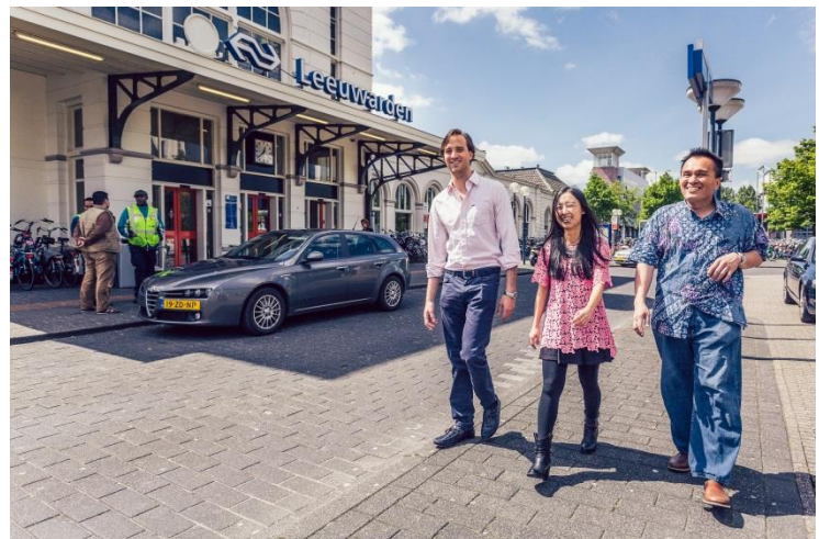
UCF masterstudenten Environmental en Energy Management (UT)

Daarnaast is met steun van UCF1-middelen door de RUG een kleinschalige pilot gestart van een honours master (extra programma, bovenop een reguliere master) High tech systems and materials, in samenwerking met Philips Drachten en de UT. Onderzocht wordt hoe deze honours master verder kan worden verbreed qua thematiek, aantallen studenten en bedrijven waarmee wordt samengewerkt (field labs). Er lijken volop kansen te zijn om tot een volwaardige masteropleiding op dit terrein te komen, aansluitend op het speerpunt 'high tech maakindustrie' in de Kennisagenda en het project van HTSM-Noord "Region of smart factories".